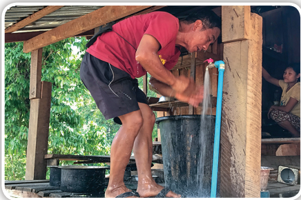
Еден од селаните ја користи славинаша по воспоставување на водоводот.

Во согласност со повикот од овие мештани, Адвентистичката црква основа училиште во ова село во јуни 2016 година. Во моментот во училиштето има 40 запишани ученици. Сите деца од селото го посетуваат ова учи-